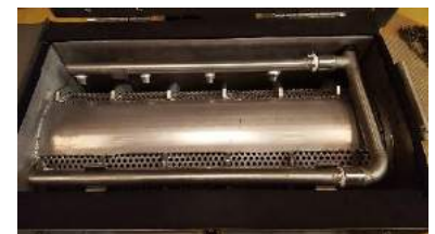
Zone de compactage