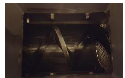
Trémie entrée déchets