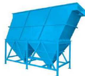
Dans décanteur lamellaire acier