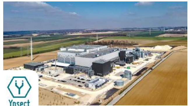
Usine agroalimentaire Poulainville, FRANCE

Notre client, Ynsect, construit sa troisième ferme verticale spécialisée dans la production d'insectes, couvrant une superficie de 45 000 mètres carrés. La station de traitement des eaux usées sur site nécessite un tamis fin afin de garantir que les eaux usées issues des process respectent les normes de rejet dans le réseau municipal d'assainissement.